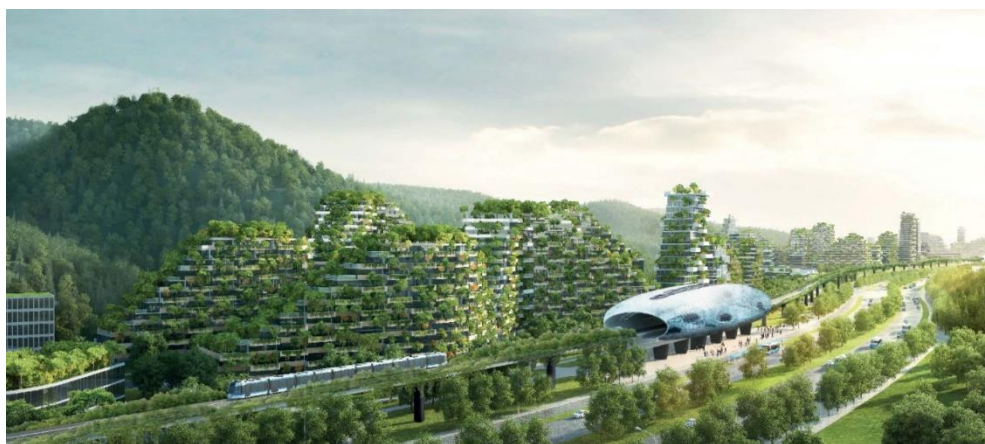
Figuur 3: Referentiebeeld Liuzhou Forest City (Stefano Boeri Architetti)

De centrale onderzoeksvraag van de conceptstudie is hoe een overkoepelende energiestrategie voor de volledige site kan worden vormgegeven. Essentieel daarbij is dat de groene stadswijk meer is dan een sterk ingegroende bebouwde zone die CO 2 reduceert maar dat er maximale symbiose wordt gerealiseerd tussen verschillende functies en op die manier ook een economische waarde biedt en de ecologische impact zelfs gunstig wordt. De conceptstudie vertrekt van de bestaande bouwfysische studies, richt zich niet op één bouwdeel van de citadel afzonderlijk maar bestrijkt de mogelijkheden van de volledige site. Ze biedt een antwoord op de centrale onderzoeksvraag vertrekkend vanuit de duurzame en zelfredzame principes die aan de grondslag liggen van de citadel en vertaalt deze naar een eigentijdse, toekomstgerichte invulling.